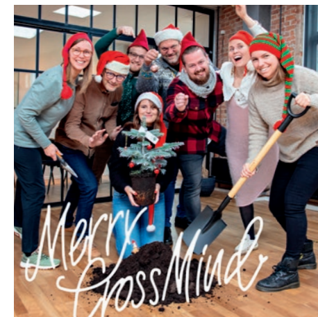
"Plant et træ" fik en juledonation.

Kort sagt fremmer politikken en holistisk tilgang til bæredygtighed i virksomhedens indkøbspraksis.